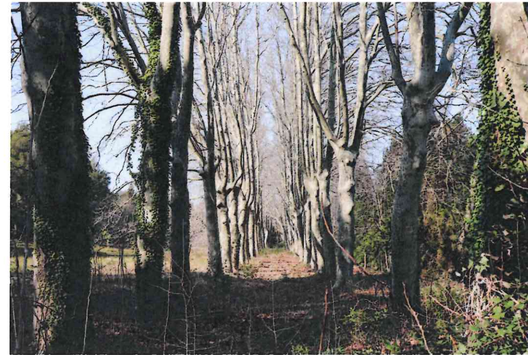
Alignement de platanes de la DPA au sud de Manville - A classer en EBC

Les alignements, bien que limités, sont présents sous forme d'un majestueux alignement de platane identifié dans la DPA au sud de Manville, et quelques alignements de platane, micocoulier et pin d'Alep. L'alignement identifié dans la DPA est proposé en EBC, les autres alignements sont préservés au titre du L151-19 ou de l'article L151-23 du CU.