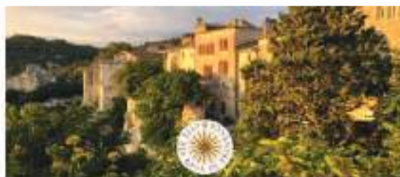
Commune des Baux-de-Provence - Lettre info n°3

Sur Facebook et sur Instagram taggez vos posts avec : @communedesBauxdeProvence @LesBauxTourisme #communebauxdeprovence #lesbauxdeprovence #lesplusbeauxvillagesdefrance